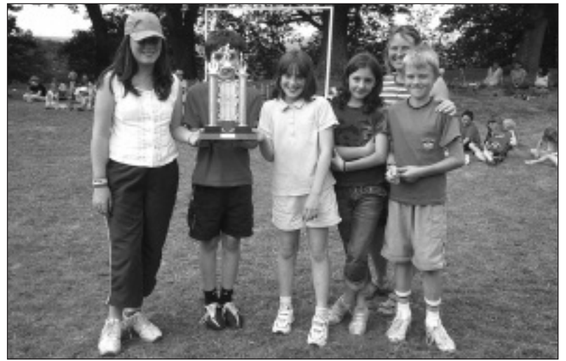
Capteiniaid timau mabolgampau

Y cysylltiad rhwng y wlad a'r dref oedd pwnc y prosiect hwn. Cafodd y disgyblion eu hannog i ddefnyddio'r celfyddydau gweledol i gyfleu eu bywydau eu hunain a bywyd cymuned arall. Wrth deithio ar