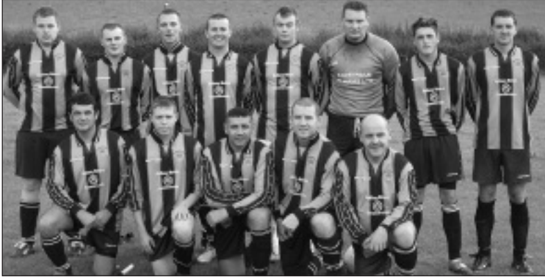
Tîm Pêl-Droed Tal-y-bont: yr ieunctid ac ambell i hen ben