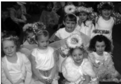
Côr o angylion yn barod i fynd â'r neges pwysig i'r bugeiliaid

Bu'r disgyblion yn gwyllo'r pantomein 'Helâr Twrch Trwyth' yng Nghanolfan y Celfyddydau ar ddechrau'r mis, cafwyd bore hwyllog dros ben a phawb wedi mwynhau'n fawr iawn.