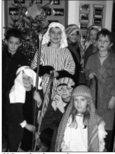
Y Bugeiliaid yn cychwyn am Fethlehem