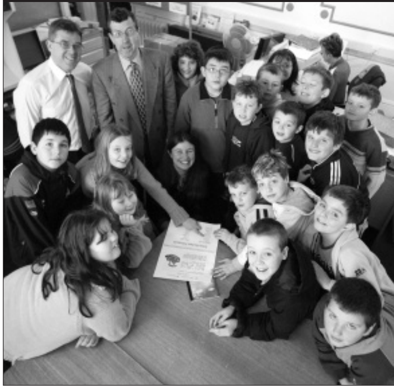
Disgyblion B6 Ysgol Gymunedol Tal-y-bont yn cyflwyno copi o'u prosiect ar y cyfrifiad i Archifdy Ceredigion.