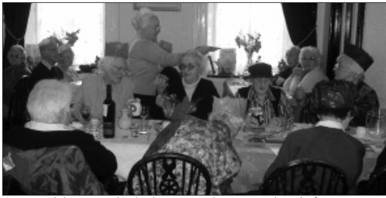
Cinio Nadolig Henoed Tal-y-bont yn y Llew Du, wedi ei drefnu gan bwyllgor 'Age Concern' cylch Aberystwyth.