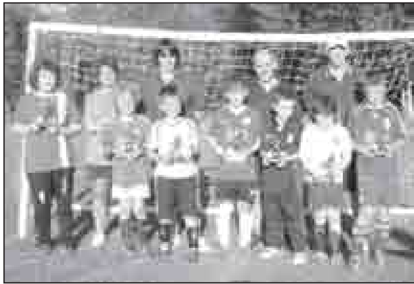
Rheolwyr timau Mini Minors Tal-y-bont yn cyflwyno gwobrau i'r unigolion a ddangosodd y mwyaf o ymroddiad a gwelliant yn ystod y tymor.