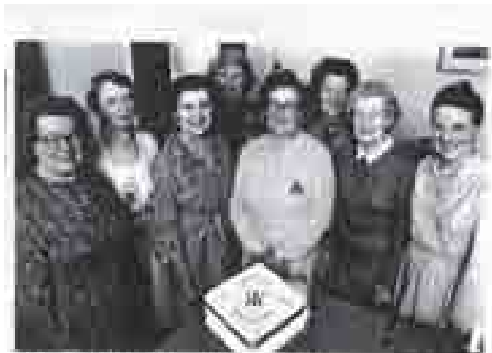
Yn ystod y 25 mlynedd diwedd y 1950s, roedd y ffatrioedd gwlan yn parhau'n ddifodol yn y pentref.