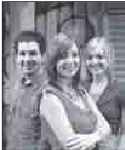
Cyflwynwyr Uned 5

"Yn ystod yr wythnosau nesaf, byddwn yn holi barn y rhai sydd â diddordeb yn y maes hwn