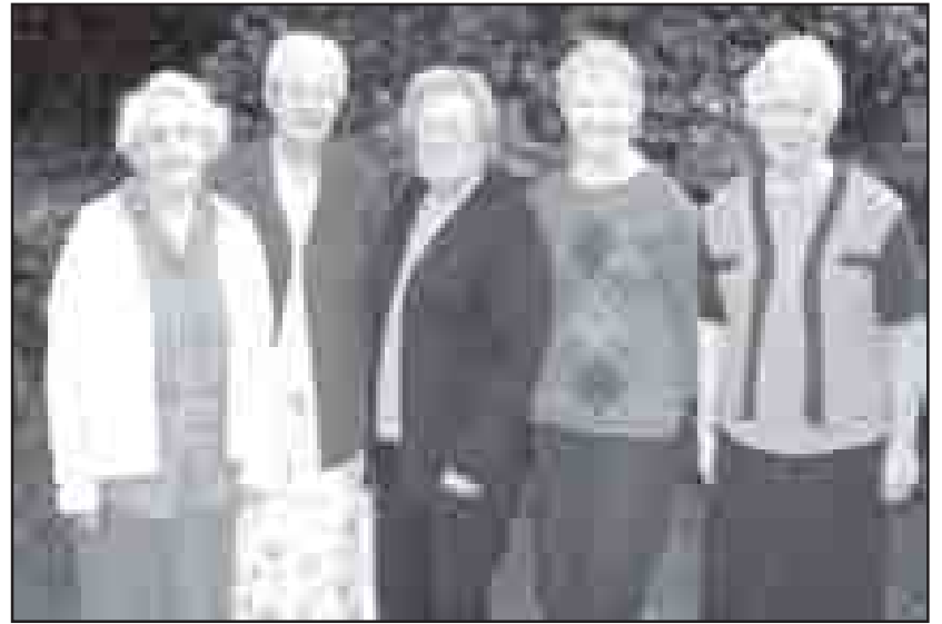
Aelodau'r gangen a ddaeth yn ail trwy Geredigion yn yr Wyl Fai a gynhaliwyd yn Llambled yn ddiweddar.