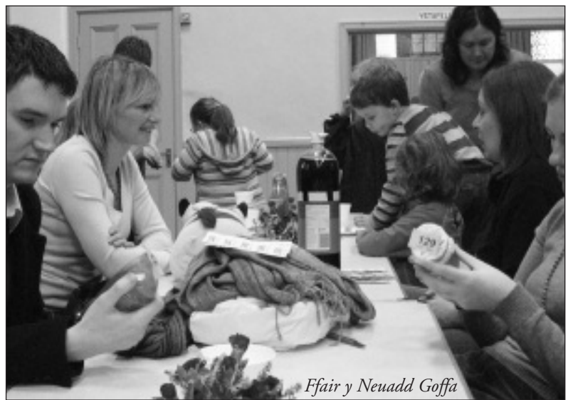
Ffair y Neuadd Goffa