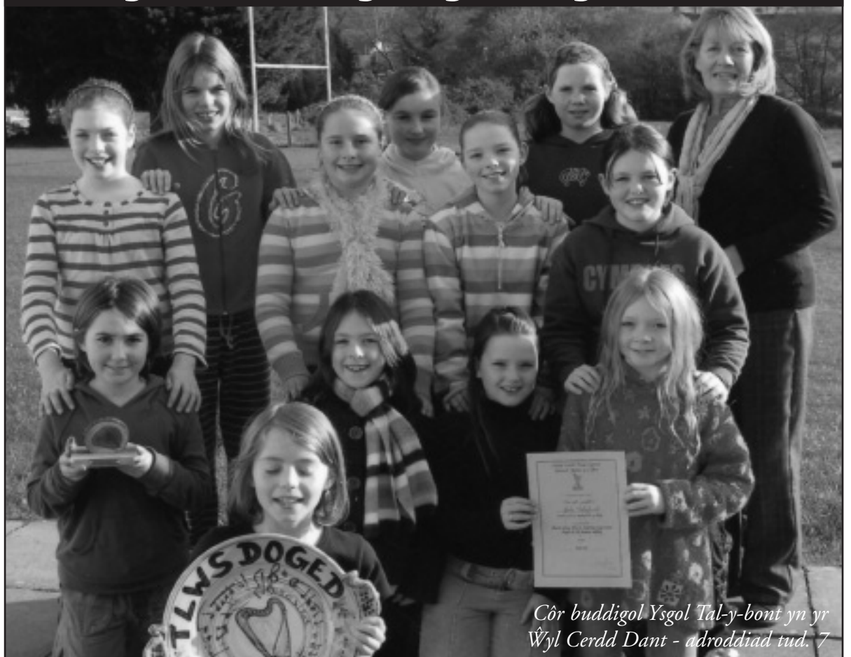
Côr buddigol Ysgol Tal-y-bont yn yr Ŵyl Cerdd Dant - adroddiad tud. 7