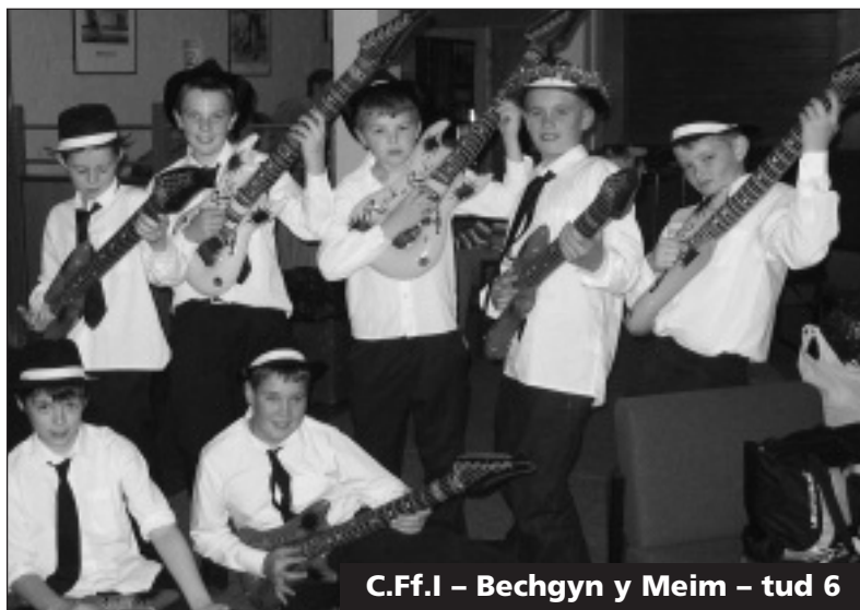
C.Ff.I – Bechgyn y Meim – tud 6