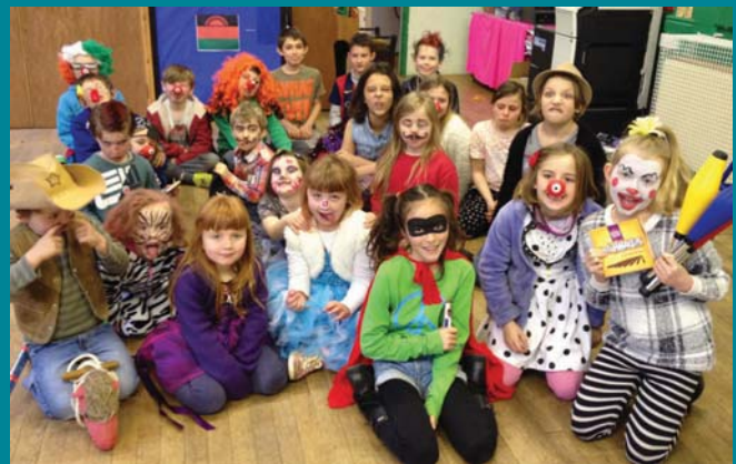
Diwrnod Trwyn Coch