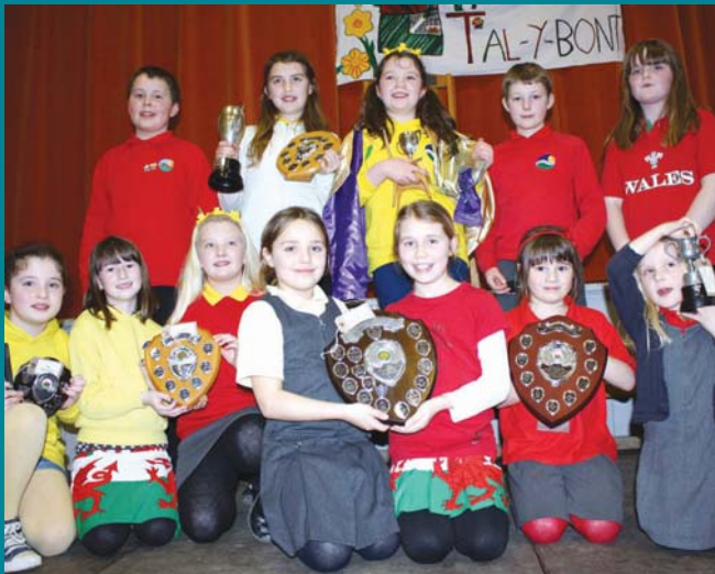
Prif enillwyr yr Eisteddfod