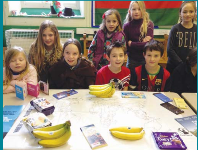
Pythefnos Masnach Deg