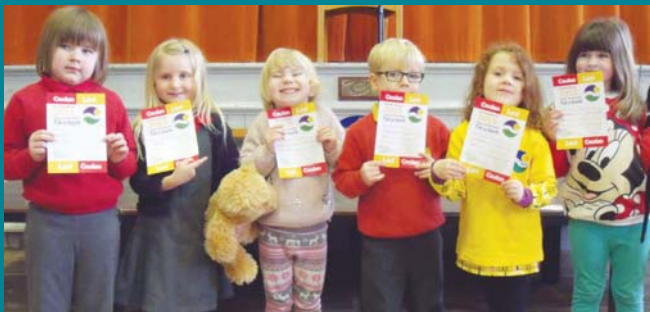
Enillwyr y Cyfnod Sylfaen