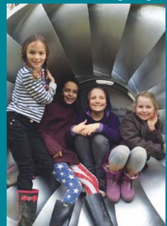
Ymweliad i Waith Egni Dŵr Dyffryn Rheidol