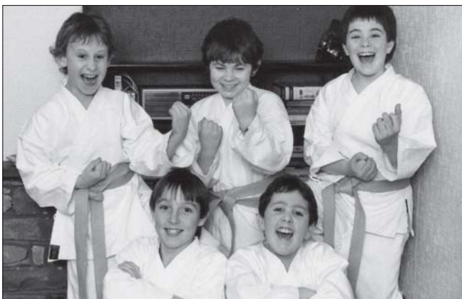
Tîm karate Tal-y-bont, 1986

APÊL 2 – Ers tua'r flwyddyn 2000 mae Papur Pawb yn cael ei baratoi'n ddigidol ac mae'r ffotograffau hefyd wedi'u tynnu gan gamerau digidol. Bydd y rhai mwyaf hirben ohono chi wedi cadw'r ffotograffau ar eich cyfrifiadur a byddwn yn ddiolchgar iawn petaech yn anfon copiau ohonyn nhw i'w cynnwys yn archif y papur. Cysylltwch â'r golygydd cyffredinol am fwy o fanylion.