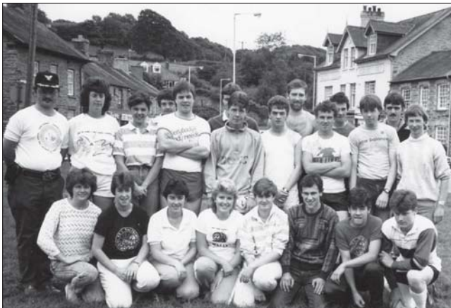
Y Chub Ffermyr Ifanc, 1987

Mae modd gweld dros 230 o hen lluniau Papur Pawb ar y we erbyn hyn. Cewch eu gweld ar wefan Casgliad y Werin: www.casgliadywerin.cymru