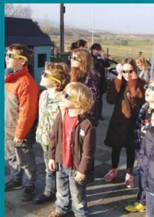
Diffyg yr haul