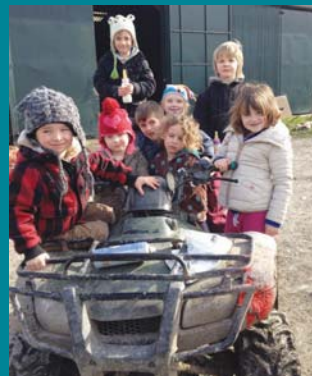
Ymweliad i Fferm Tanllan