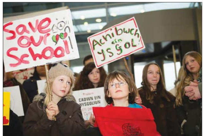
Plant Ysgol Llangynfelyn yn protestio

Aeth Louise ymlaen i ddweud: “Yn ôl rheolau ESTYN nid yw'n bosibl ad-drefnu addysg er mwyn gwneud arbedion cyllidebol fel y mae'r rhieni'n ddrwgdybio. Dim ond er budd y disgyblion y gellir cyfiawnhau ad-drefnu ysgolion.”