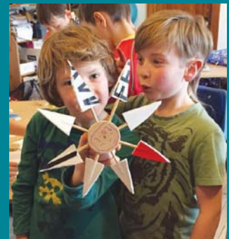
Ymweliad i Ganolfan y Dechnoleg Amgen