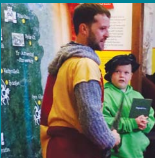
Cwrdd ag Owain Glyndŵr