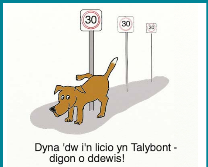
Dyna 'dw i'n licio yn Talybont - digon o ddewis!