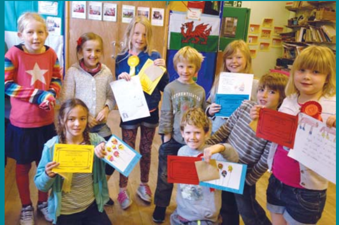
Sioe Arddwriaethol Llangynfelyn