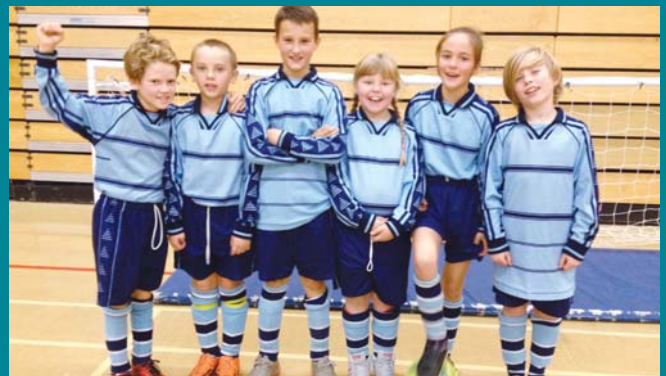
Pêl-droed 5-bob-ochr yr Urdd