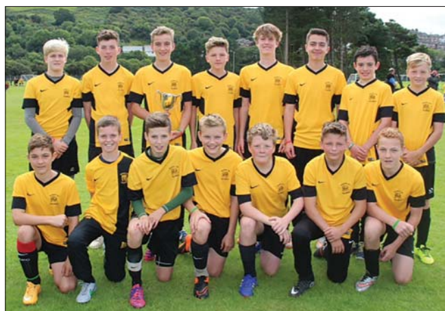
Enillwyr dan 14, Tal-y-bont