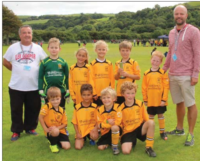
Enillwyr dan 8, Tal-y-bont Teirw

Cafodd tri o dimau Ieuencid Tal-y-bont hwyl arni yng Ngŵyl Bêl-droed Gary Pugh gan ennill yn yr adrannau dan 8, dan 10 a dan 14. Bydd saith tîm gyda'r Ieuencid eleni yn cystadlu yng Nghyngair Ieuencid Aberystwyth. Dymuniadau da i bob un ohonynt.