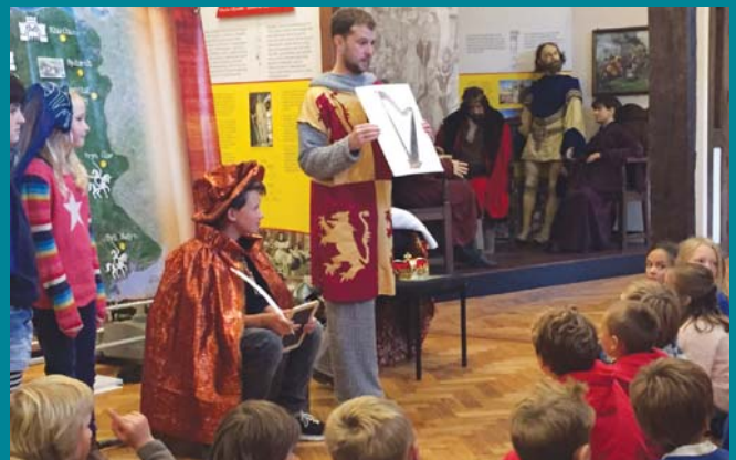
Sioe Owain Glyndŵr