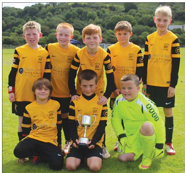
Enillwyr dan 10, Tal-y-bont Taranau