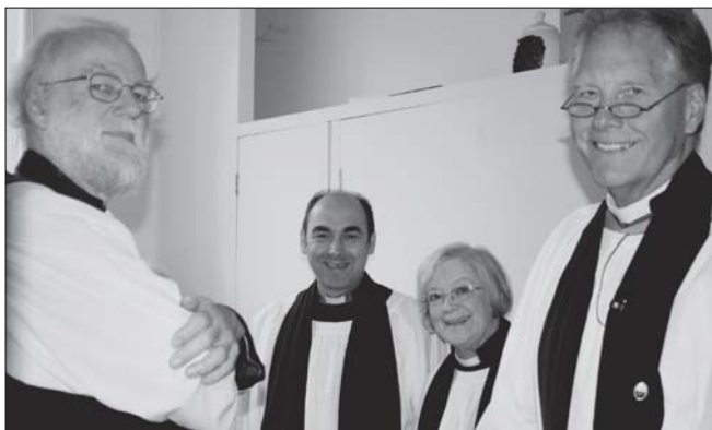
Dr Rowan Williams (ar y chwith) gyda rhai o'r offeiriad enaill a fu'n cymryd rhan.

Cynhaliodd Eglwys San Mihangel Wyl R.S. Thomas lwyddiannus iawn ym mis Medi gyda'r Eglwys yn llawn ar gyfer bob digwyddiad. Arweiniodd y Dr. Rowan Williams, cyn Archesgob Caergaint wasanaeth a rhoddodd araith fel rhan o'r achlysur. Roedd y gystadleuaeth farddoniaeth yn boblogaidd iawn gyda dros 30 o gynigion. Bydd peth o'r elw yn mynd tuag at 'Barnabus Christian fund' i gefnogi plant ffoaduriaid.