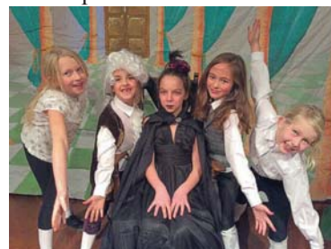
Pobl Y Castell a Llys Barn

Ar ôl y sioe, aeth pawb yn ôl i'r ysgol am banded a mins pei a diddanodd rhai o'r plant y rhieni gydag eitemau offerynnol. Diolchwn i'r Gymdeithas Rhieni ac Athrawon am baratoi'r lluniaeth. Diolchwn hefyd i Bwyllgor Neuadd Llanfach am eu cefnogaeth barod.