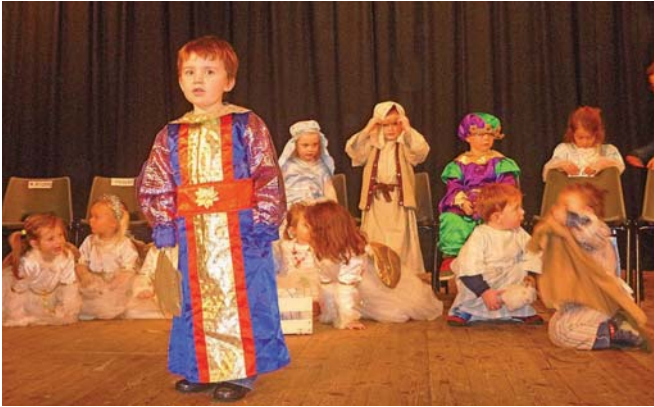
Y trydydd gŵr doeth yng Nghyngerdd yr Ysgol Feithrin

Rhai o'r stonidwyr ifanc a fu wrthi'n helpu i godi arian yng Nghyngerdd Nadolig a Noson Goffi'r Cylch Meithrin ar y 15fed o Ragfyr. Cyfanswm yr arian a godwyd oedd £846.40. Dyna adlewyrchiad unwaith eto o'r gefnogaeth arbennig mae'r Cylch yn ei dderbyn oddi wrth y gymuned leol.