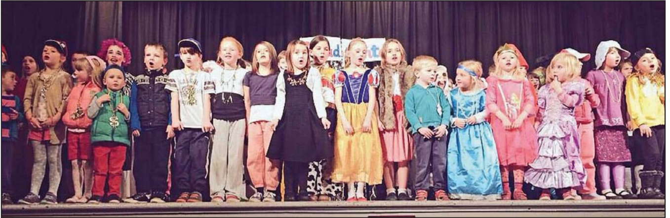
'Wel am Banto!'