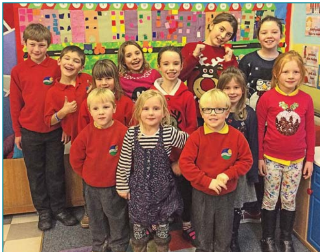
Rhai o blant hapus y Clwb ar ôl Ysgol

Gyda grant arbennig mewn argyfwng o £300 a gafwyd gan Gyngor Cymuned Ceulanamaesmawr, llwyddwyd i achub y Clwb ar ôl Ysgol yn Nhal-y-bont. Gwnaed y cais am gymorth brys i'r Cyngor wedi iddi ddod i'r amlwg nad oedd digon o arian ar gael yn y coffrau i dalu cyflogau'r cynorthwywyr ar ddiwedd y tymor.