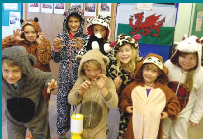
Plant Mewn Angen