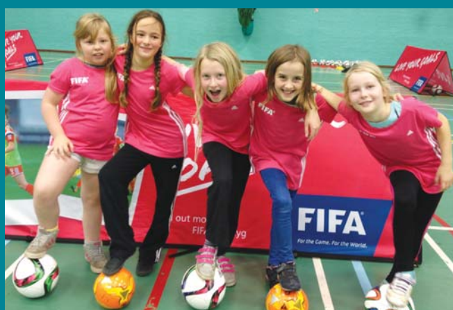
Pêl-droed 'Live Your Goals'