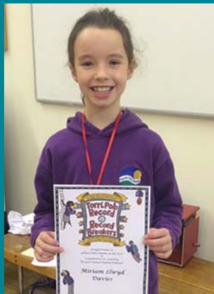
Her ddarllen Llyfrgell Ceredigion