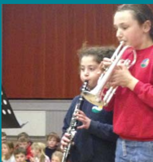
Goleuo Coeden y Pentref