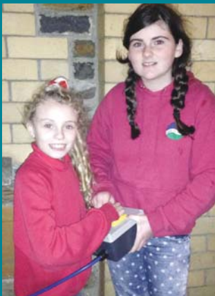
Goleuo Coeden y Pentref