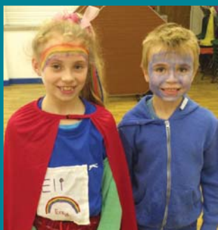
Diwrnod Plant Mewn Angen