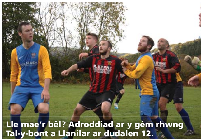
Lle mae'r bêl? Adroddiad ar y gêm rhwng Tal-y-bont a Llanilar ar dudalen 12.