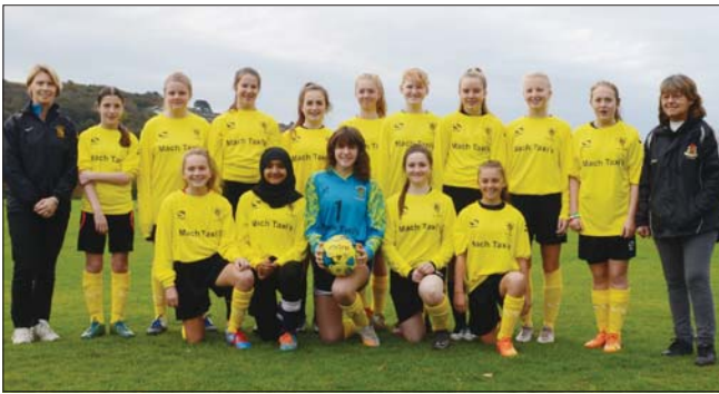
Tîm pêl-droed merched dan 14 oed Tal-y-bont yn eu cit newydd.