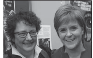
Elin Jones a Nicola Sturgeon