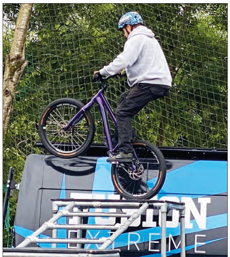
Arddangosfa gan feiciau Fusion Extreme