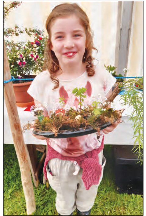
Cadi Wên â'i gardd fach ar blât