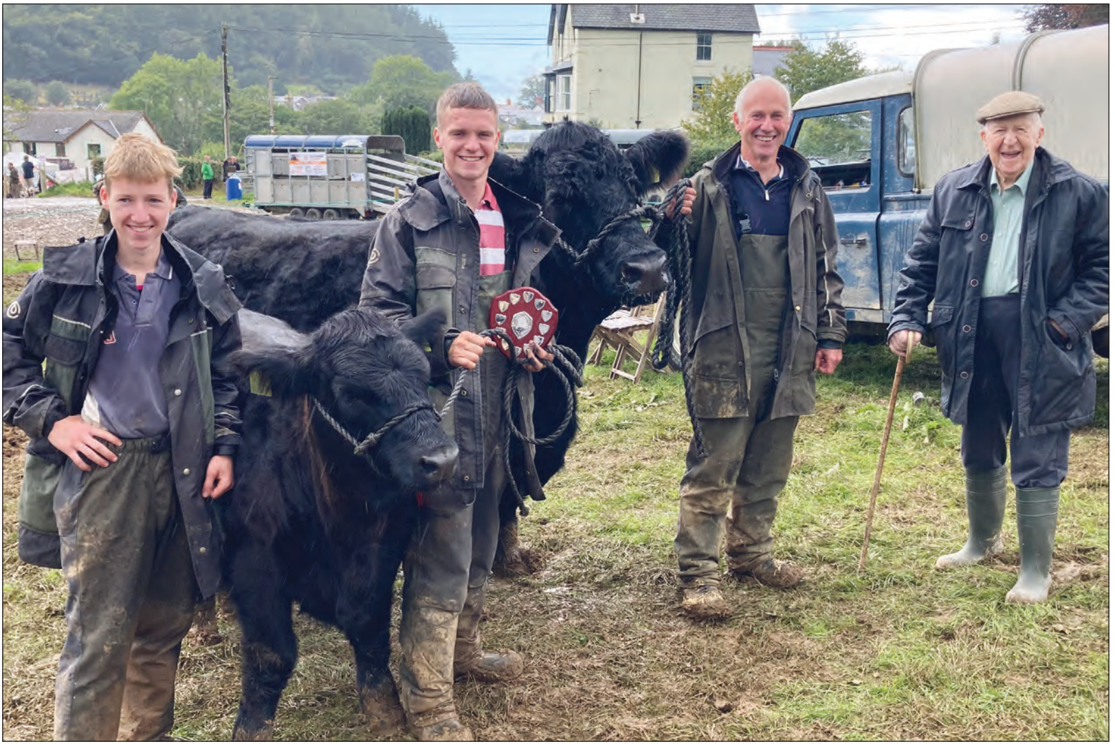
Arglwyddes Riwbi a'i llo wedi enmill prif bencampuriaeth adran y gwartheg i deulu Tannallt