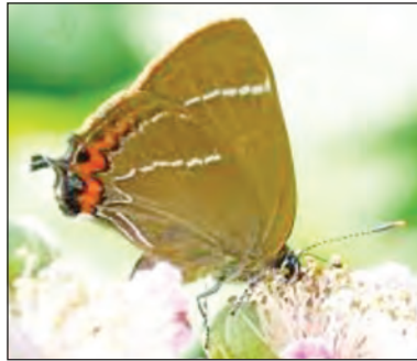
Y Brithribin W Wen

Braf yw cael cyflwyno tamaid bach o newyddion da am fyd natur, lle mae'r darlun at ei gilydd yn dangos dirywiad cyflym. Prin iawn yw'r Brithribin W Wen yn ngorllewin Cymru a Phrydain ond gwelais i hi yma dros yr haf eleni. Mae'r enw yn cyfeirio at y patrwm o dan ei hadain sy'n edrych fel siâp W.