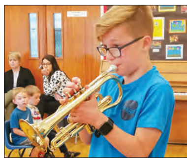
Unawd trumped gan Tomos. Arddangosfa gan feicwyr Fusion Extreme