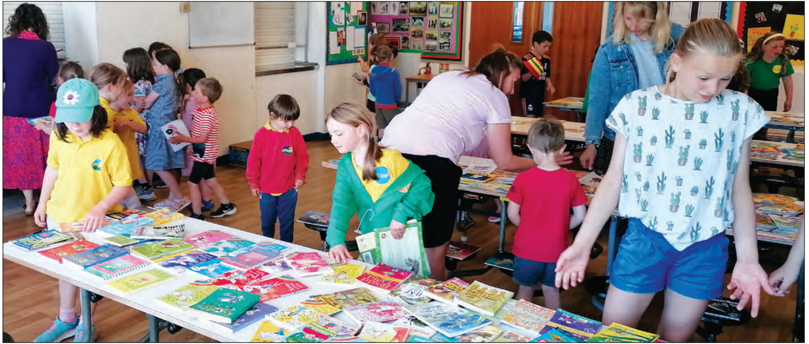
Diwrnod truco llyfrau