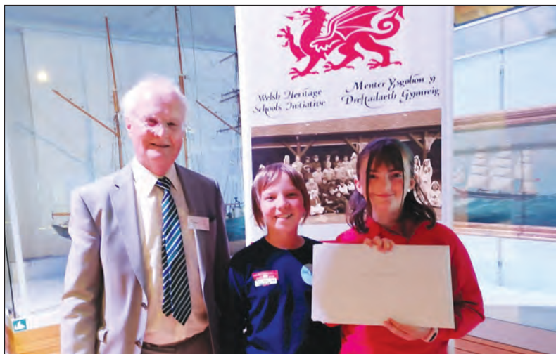
Derbyn gwobr yn Amgueddfâr Glannau, Abertawe