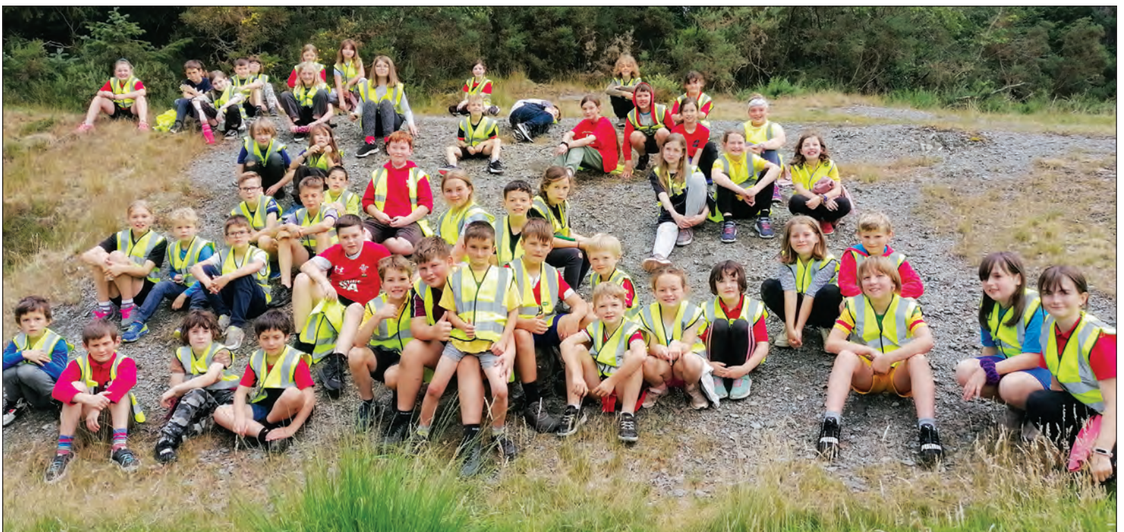
Yr ysgol gyfan yn cael hoe ar ben Allt y Crib