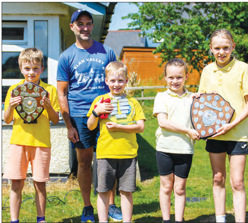
Diwrnod mabolgampau llwyddiannus