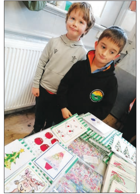
Ffair y Neuadd

Hoffwn ddiolch yn fawr i bawb am helpu gyda'r stondin ysgol yn y ffair brysur – yn rhieni a phlant! Roedd hi'n hyfryd i weld cymaint o brysurdeb yn y Neuadd Goffa ac ar ein stondin eleni eto. Roedd y peintio wynebaw'n arbennig o brysur a phoblogaidd!