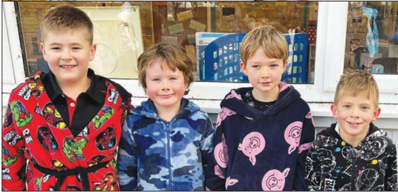
Diwrnod Plant Mewn Angen