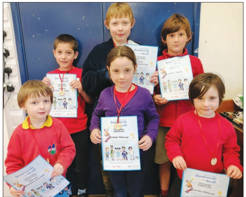
Her ddarllen Llyfrgell Ceredigion