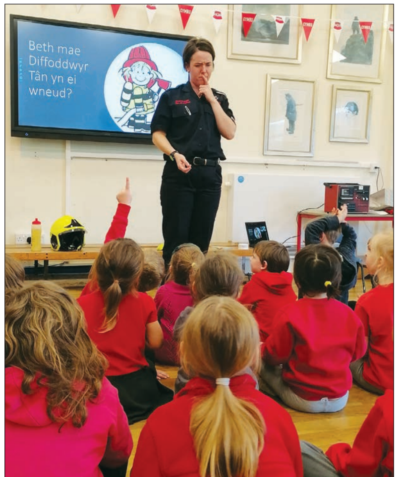
Ymweliad y Gwasanaeth Tân