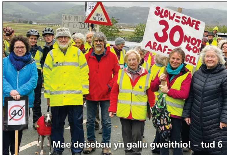
Mae deisebau yn gallu gweithio! – tud 6