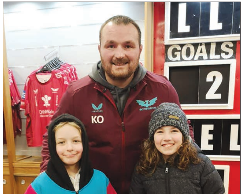
Ymweliad i Barc y Scarlets