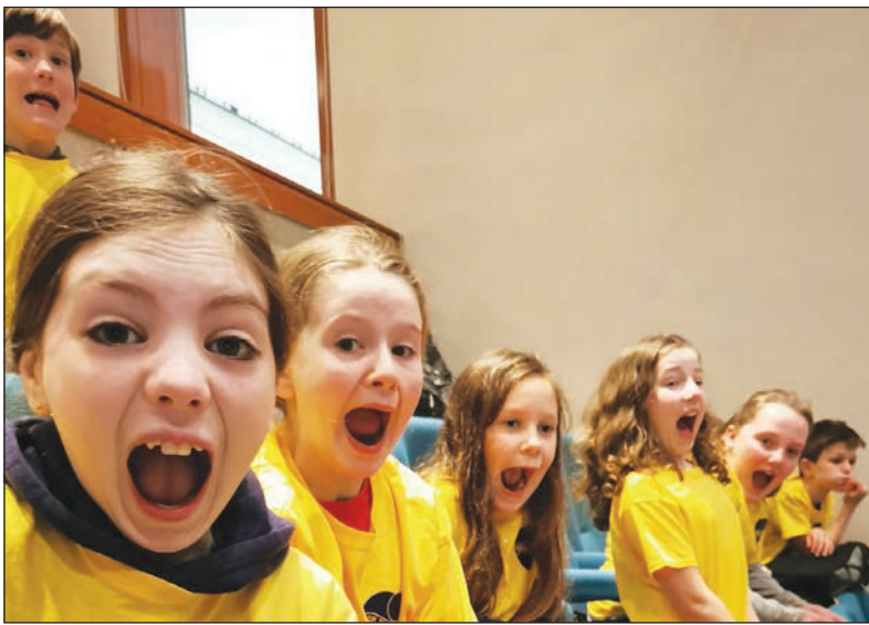
Ysgol Greadigol – Côr Cymru