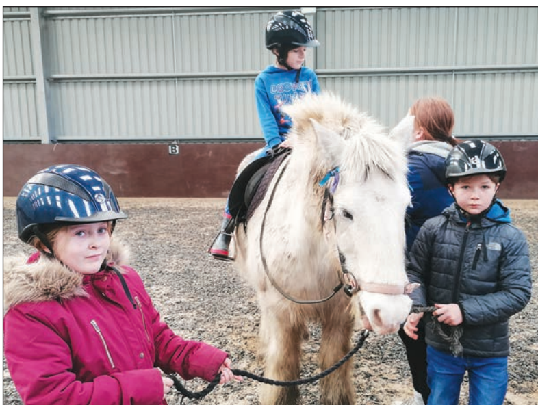
Gwersyll yr Urdd, Llangrannog