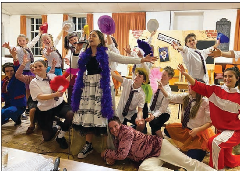
Aelodau Clwb Ffermwyr Ifanc Tal-y-bont a'r Cylch yn paratoi at y 'Cystadleuaeth Hanner Aur o Adloniant' yn 2023.