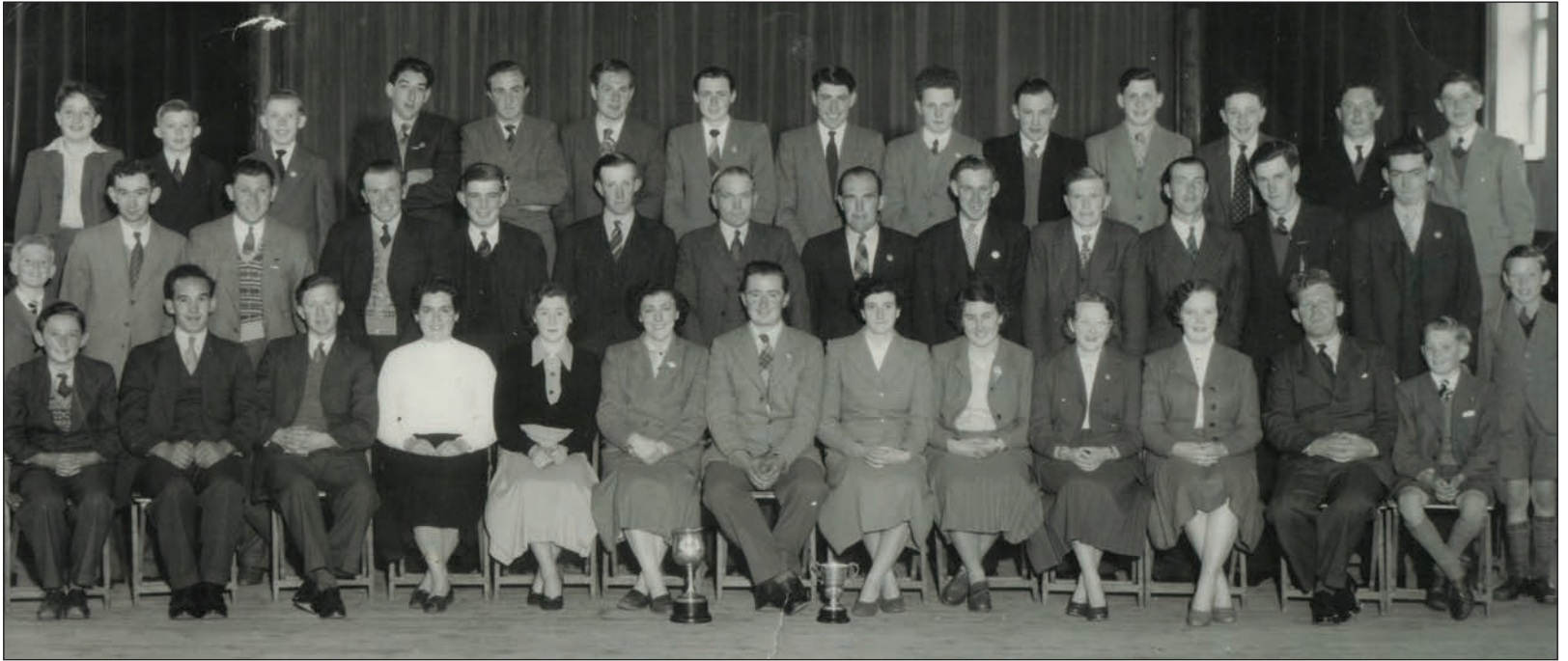
Aelodau Clwb Ffermwyr Ifanc Tal-y-bont a'r Cylch 1954/5