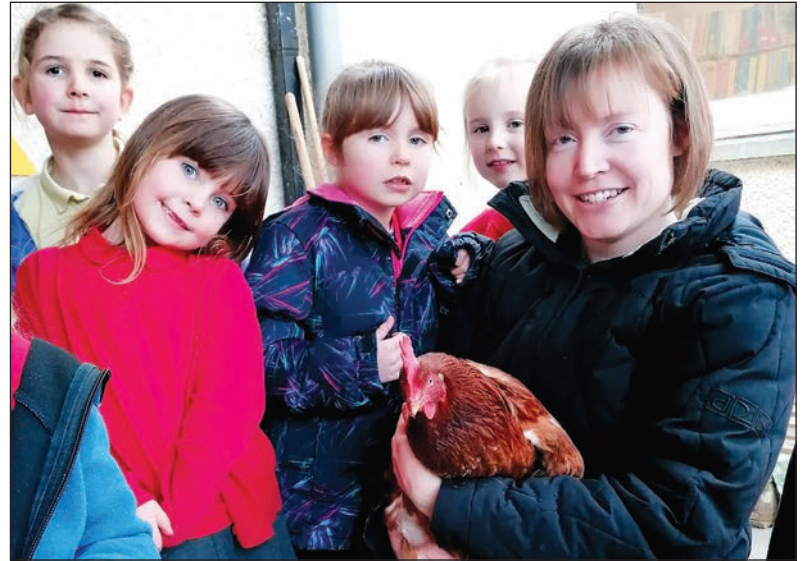
Iâr Fach Goch