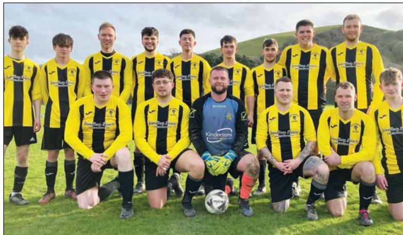
TÎM TAL-Y-BONT 2024

Ar y dde ceir llun o'r tîm presennol a dynnwyd cyn y gêm yn erbyn Borth. Er i'r bechgyn golli 1-3, maent wedi cael tymor eithaf boddhaol hyd yn hyn.