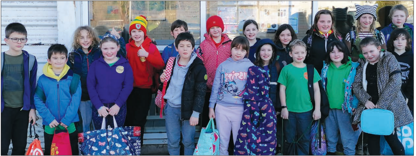
Ysgol Iach – Gala Nofio