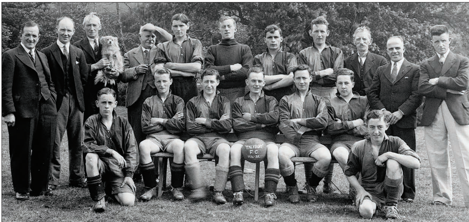
TÎM TAL-Y-BONT 1934