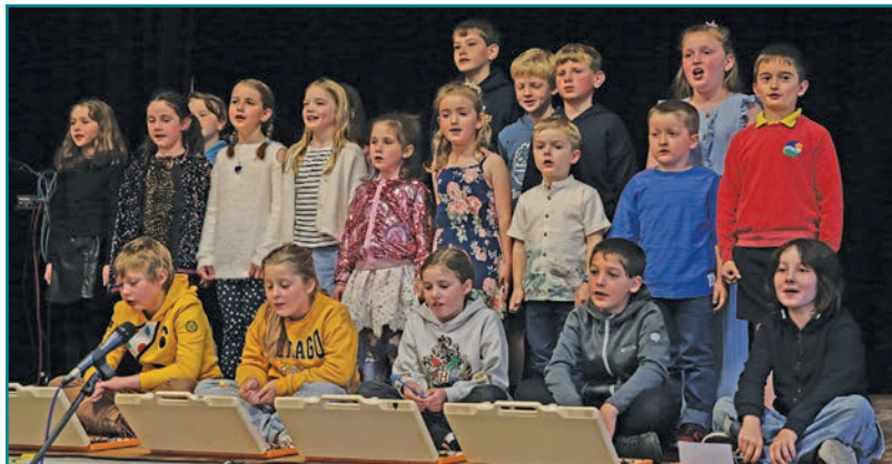
Côr yr Ysgol yn canu 'Teulu mawr ŷm ni i gyd'