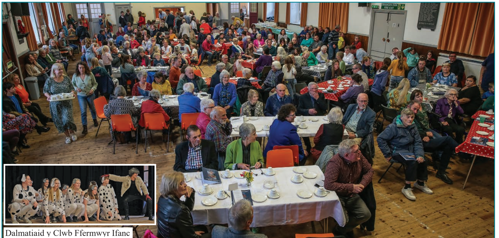
Dalmatiaid y Clwb Ffermwyr Ifanc