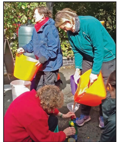
Gwasgu sudd afalau yng Nghletwr