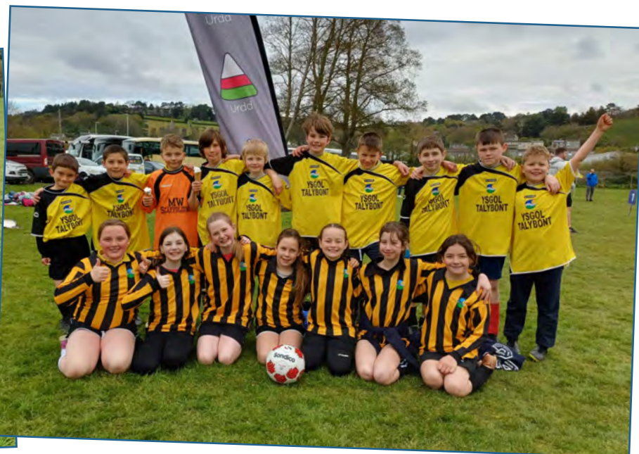
Timau pêl-droed yr ysgol