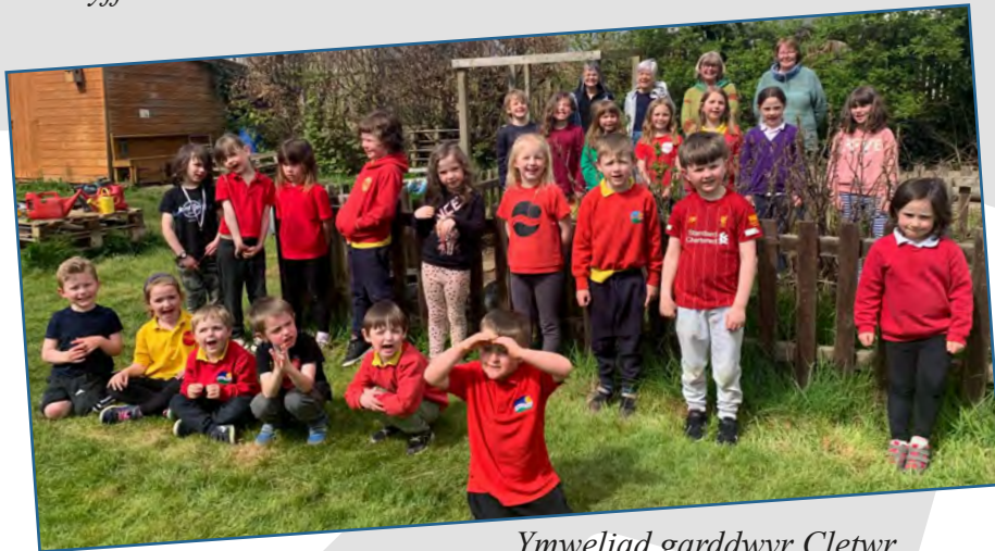
Ymweliad garddwyr Cletwr