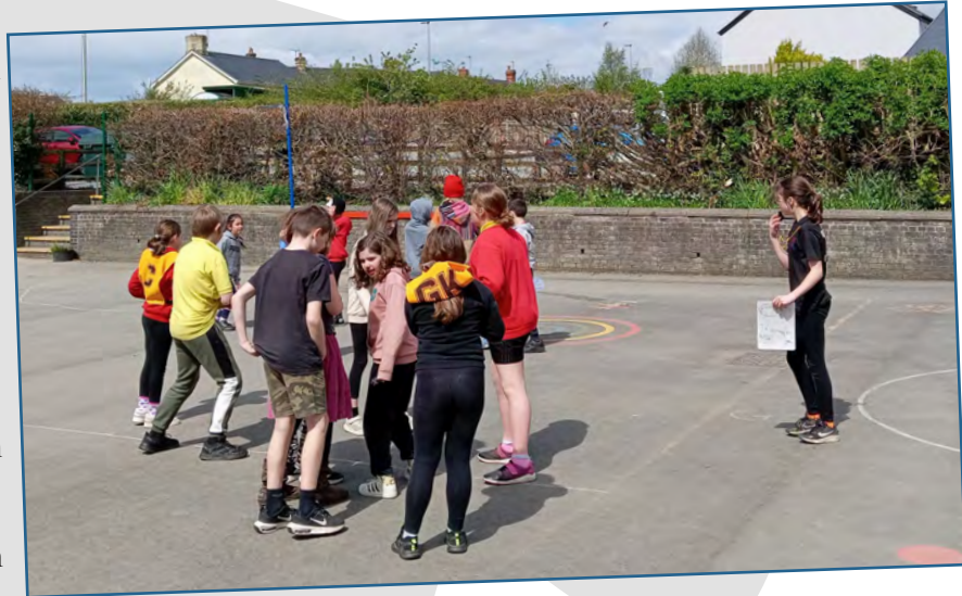
Hyfforddiant Pêl Rwyd

Aeth dau dîm o'r ysgol i gystadlu'n frwd yn erbyn plant o bob rhan o Geredigion ym mhencampwriaeth pêl-droed yr Urdd ar Gaeau Blaendolau. Fe wnaeth y ddau dîm gystadlu'n frwd drwy'r dydd gan ennill rhai o'u gemau. Roedd yn brofiad gwych i rai disgyblion Blwyddyn 4 gael y cyfle o gynrychioli'r ysgol am y tro cyntaf – da iawn bawb.