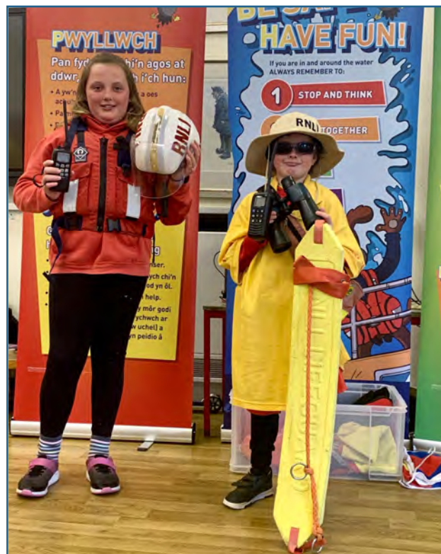
Helpu Tîm y Bad Achub