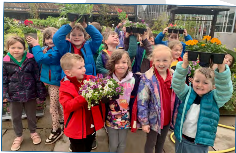
Gwibdaith i Ganolfan Arddo Newmans