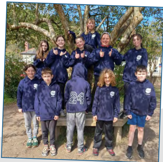
Plant Blwyddyn 6 yn edrych yn smart yn eu hwdis gan Gwmni Ceirios