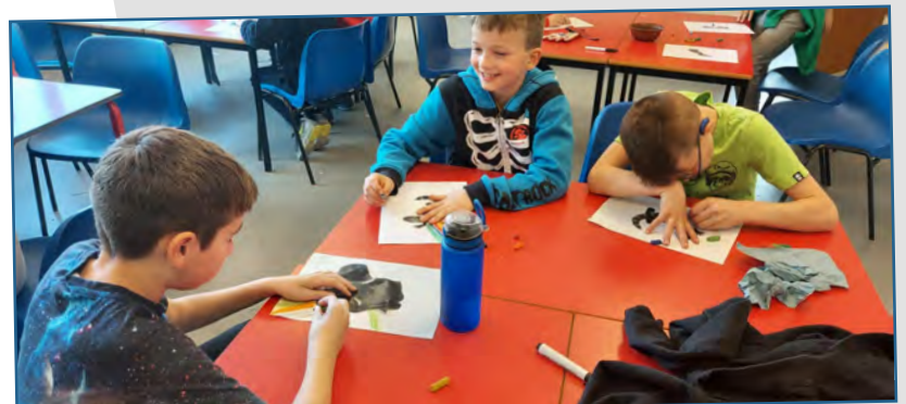
Y bois yn mwynhau gweithdy celf Blythe a Teal