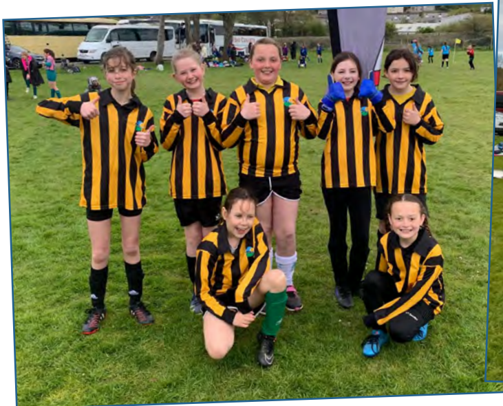
Tîm pêl-droed y merched