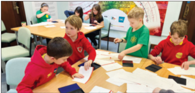
Llyfrgell Genedlaethol Cymru