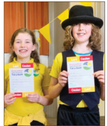
Eisteddfod yr Ysgol