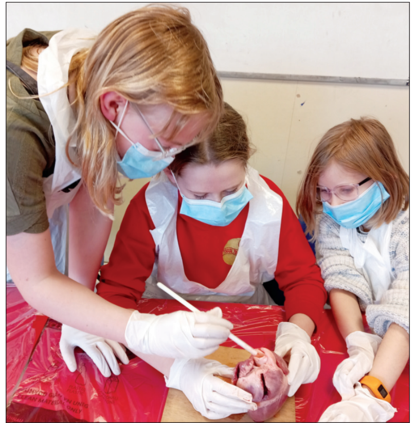
Ymchwilio i berfedd calon mochyn