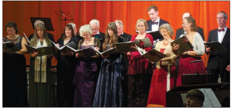
Aelodau AberOpera yn diddanu

Daeth selogion a chariadon cerddoriaeth AberOpera at ei gilydd ar 16 Chwefror yn y Neuadd Goffa am noson o alawon operatig hudolus, i gyd ar gyfer achos da. Roedd neuadd y pentref yn atseinio caneuon clasurol wrth i gyfranogwyr a mynychwyr ymgasglu i godi arian ar gyfer Cronfa Cae Bach y plant.