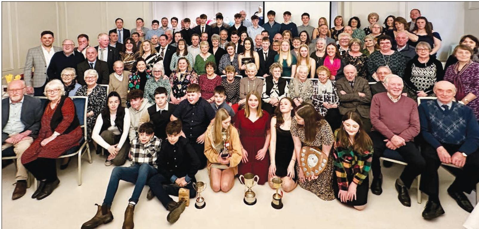
CFFI Tal-y-bont yn dathlu

Mewn awyrgylch hwyliog, dathlodd Clwb Ffermwyr Ifanc Tal-y-bont ei phen-blwydd yn 70 oed. Ar 24 Chwefror roedd gwesty'r Marine dan ei sang! Roedd y digwyddiad, a fynychwyd gan aelodau presennol a chyn-aelodau, yn daith galonogol o gyfeillgarwch, twf ac atgofion. Roedd yn adlewyrchiad teimladwy ar hanes cyfoethog y sefydliad ac yn dyst i'r effaith barhaol y mae wedi'i chael ar y gymuned.