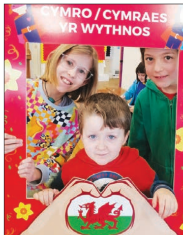
Rhai o siaradwyr Cymraeg y mis

Un o brofiadau gorau llawer o'r plant hyn eleni oedd cael agor calon mochyn wrth ddysgu am gylchrediad y gwaed. Er gwaethaf ambell stumog wan, roedd cael cyffwrdd ac ymchwilio wedi atgyfnerthu eu dealltwriaeth o sut mae'r galon yn gweithio fel pwmp i rannu'r gwaed drwy'r corff. Diolch o galon i Rattrays y cigydd am y calonnau ac i Kath a staff Gwyddoniaeth Ysgol Penglais am gael defnyddio'r offer.