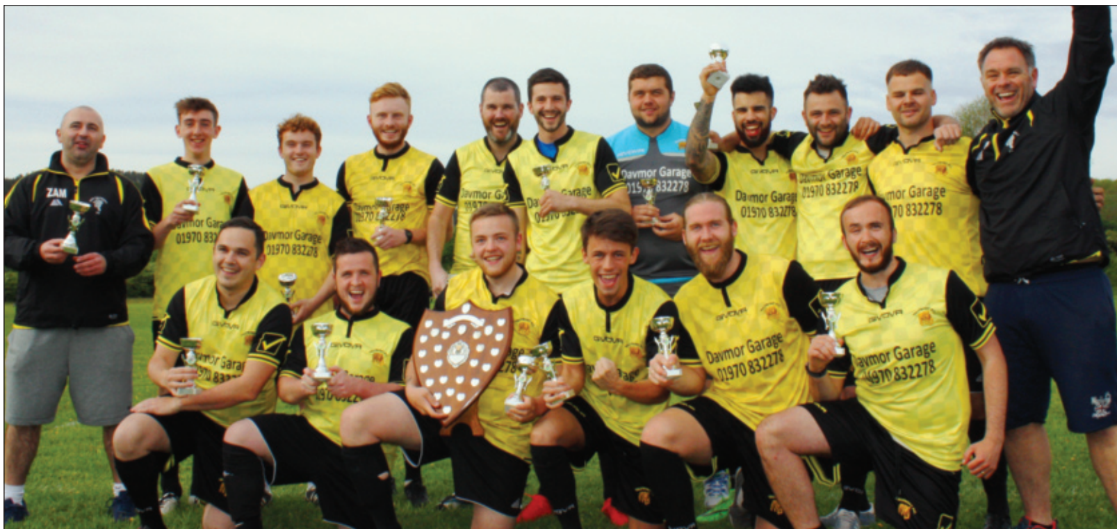
Ar adegau dros y blynyddoedd bu gan Glwb Pêl-droed Tal-y-bont ail dîm, gan gynnwys y tîm hun ag enillodd bencampwriaeth Ail Adran Cynghrair Aberystwyth a'r cylch yn 2017.