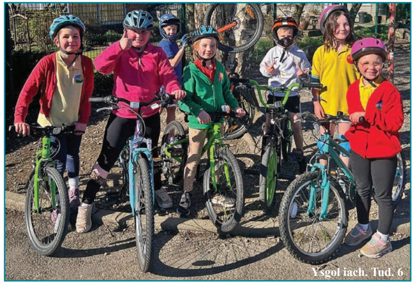
Ysgol iach. Tud. 6