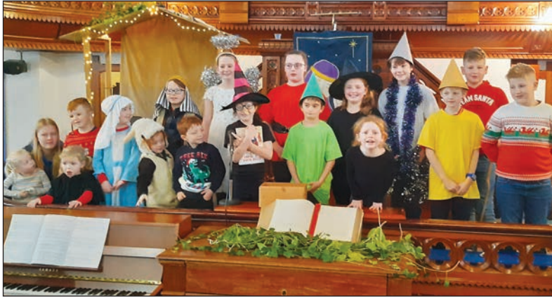
Aelodau'r Ysgol Sul yn ymarfer