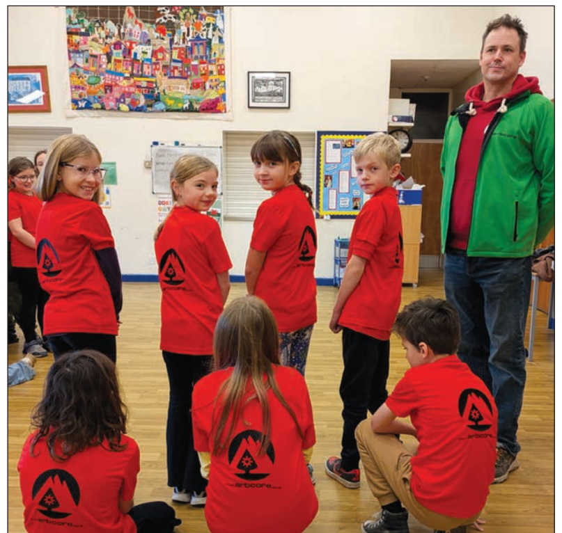
Diolch i gwmni Arbcore am noddi'r crysau T