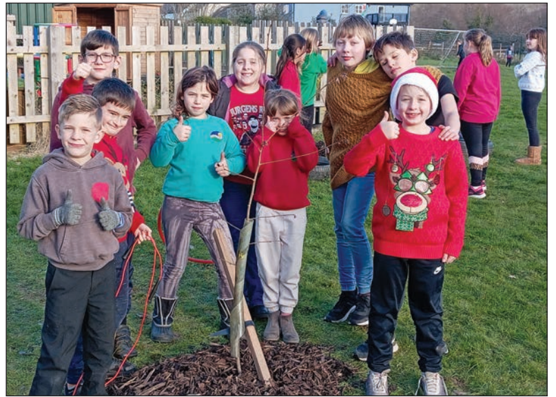
Plannu coed afalau