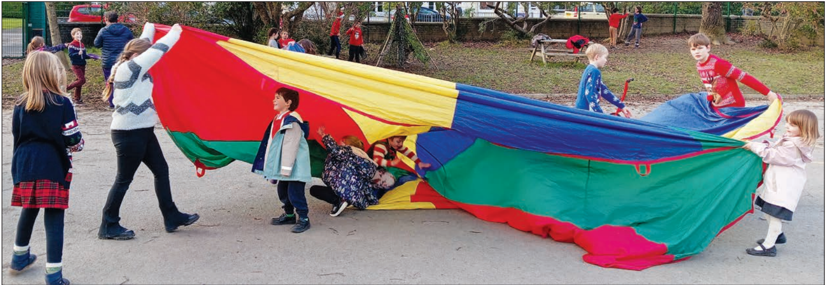
Gweithgareddau Ray Ceredigion