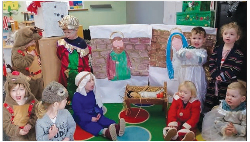
Y Cylch Meithrin yn barod i berfformio