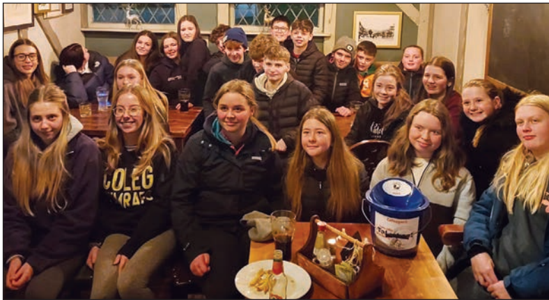
Gwibdaith canu carolau CFfi yr ardal

Daeth aelodau Clwb Ffermwyr Ifanc (CFfi) Tal-y-bont â hwyl yr ŵyl i'r gymuned ar 10 a 17 o Ragfyr gyda'u gwibdeithiau canu carolau blynyddol. Ymwelodd yr aelodau â chymdogaethau lleol, gan ledaenu llawenydd trwy gân a charol a chysylltu â thrigolion yn ystod tymor yr ŵyl.