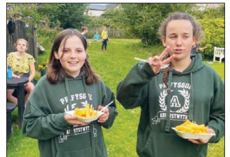
Mwynhau sglodion yn Y Llew Gwyn