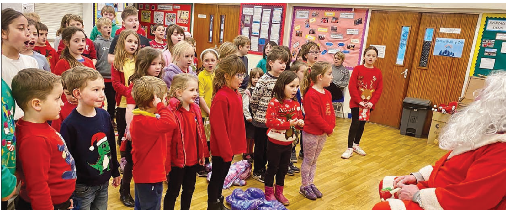
Ymweliad Siôn Corn