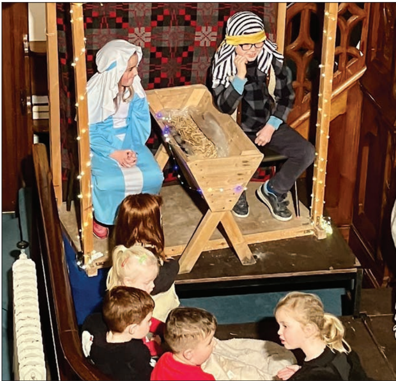
Mair a Joseff