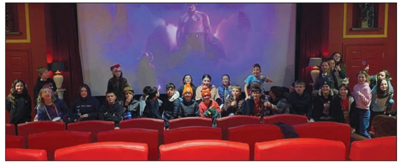
Ymweliad â sinema Libanus 1877

Cynhaliwyd Gwasanaeth Carolau ar y cyd rhwng Eglwys Llangynfelyn a Chapel Rehoboth brynhawn Sul, 22 Rhagfyr, yng nghapel Rehoboth. Yn dilyn y gwasanaeth mwynhawyd y te hyfryd a baratowyd gan rai o aelodau'r ddwy eglwys.