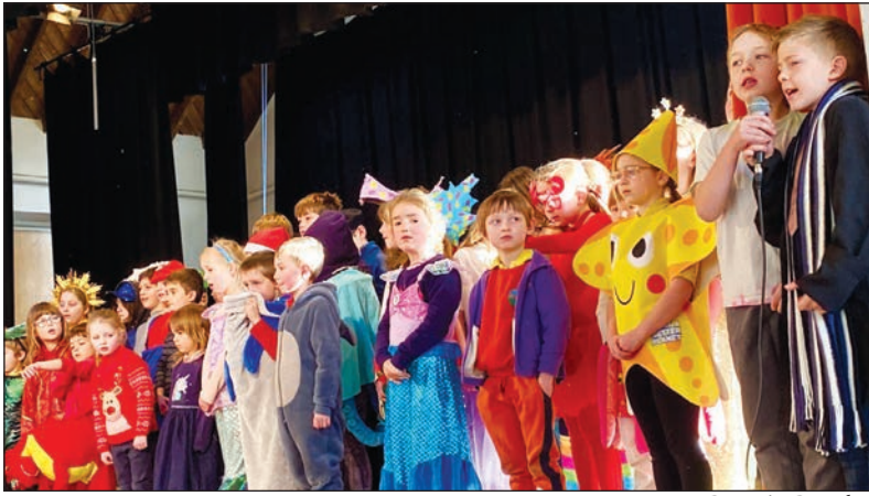
Panto Cantrêr Gwaelod