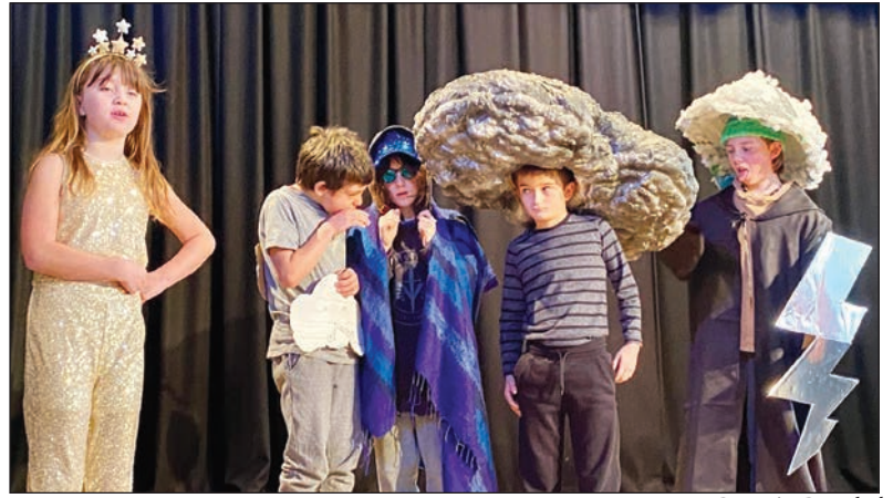
Panto Cantrêr Gwaelod