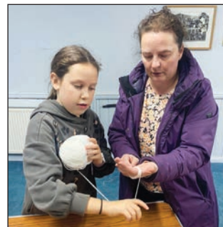
Sesiwn celf a chrefft