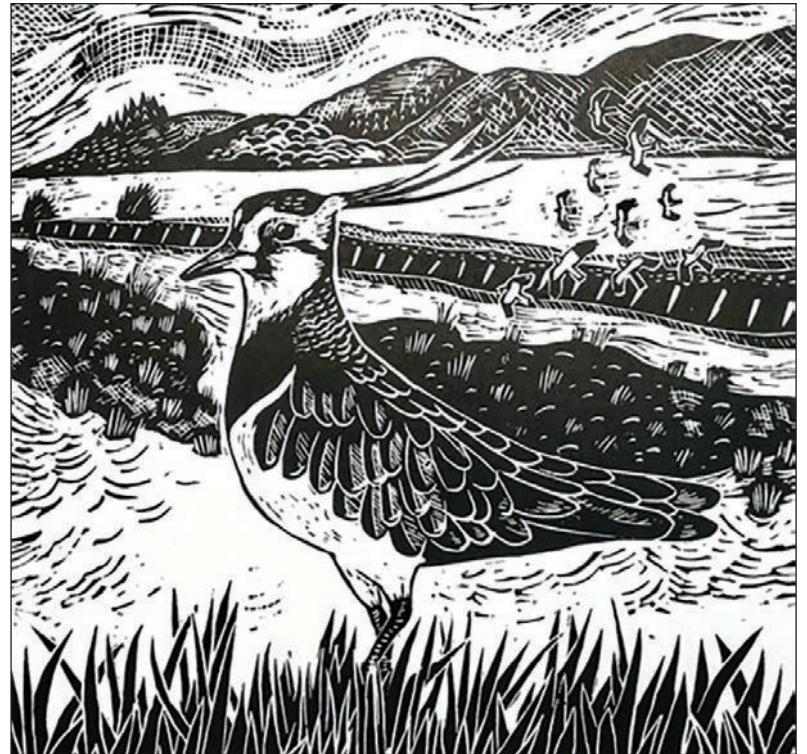
Leino print o gornchwigen yn aber afon Dyfi

Gallwch ddilyn hynt fy ngwaith yn @hannahdoyleartist a @tircanol.