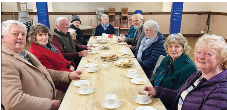
Mwynhau'r te ar ôl y gwasanaeth

Cynhaliwyd Gwasanaeth Carolau ar y cyd rhwng Eglwys Llangynfelyn a Chapel Rehoboth brynhawn Sul, 22 Rhagfyr, yng nghapel Rehoboth. Yn dilyn y gwasanaeth mwynhawyd y te hyfryd a baratowyd gan rai o aelodau'r ddwy eglwys.