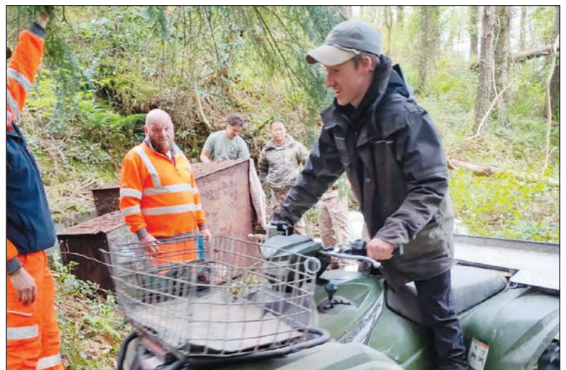
Yn yr Tan-yr-Allt, aelod dros dro o'r 'Bomb Squad'