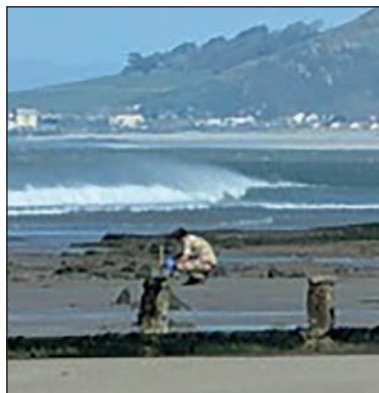
Y ffrwydro yn Ynys-las

Penderfynwyd symud y ffrwydron am ddeg o'r gloch y bore