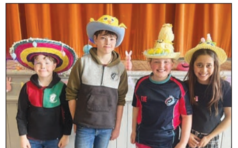
Hetiau Pasg CA2