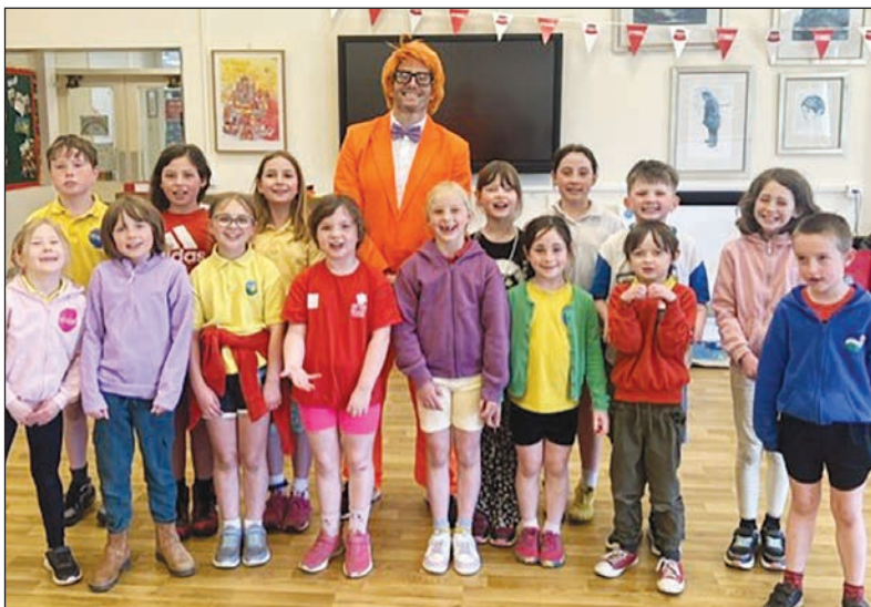
Gweithdy Gwyddoniaeth Sbarc