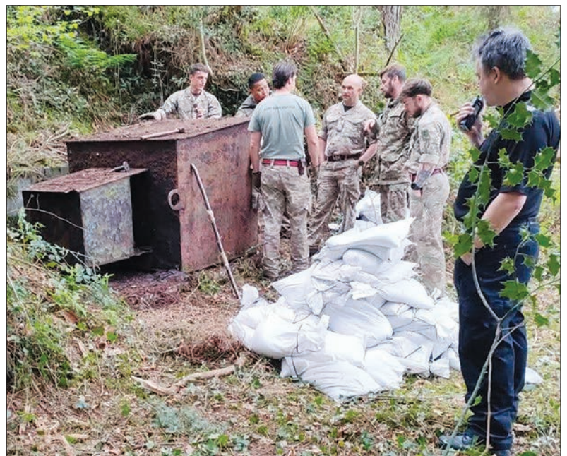
Y 'Bomb Squad' yn archwilio'r safle

canlynol a chaewyd y ffordd rhwng Tal-y-bont ac Ynys-las am gyfnod. Chwythwyd y ffrwydron ar draeth Ynys-las.