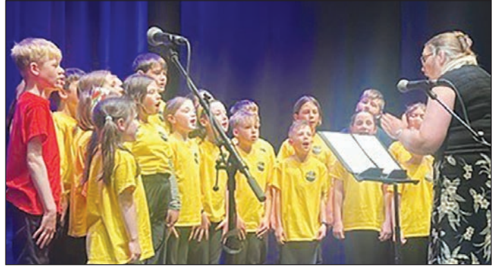
Eisteddfod yr Urdd