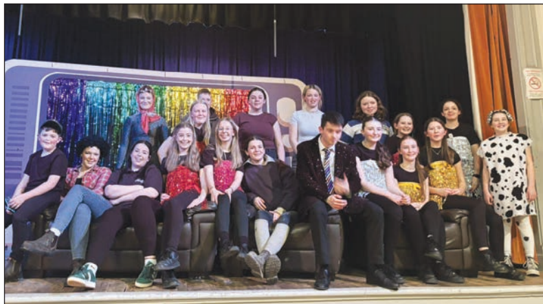
Aelodau CFfl Tal-y-bont yn perfformio