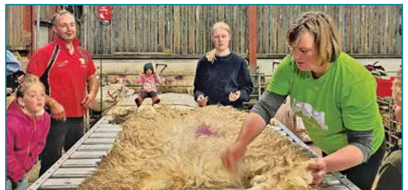
Dysgu sgil trin gwllân

Wedi i'r arwydd fynd i fyny, dechreuodd yr ymarferion o ddifrif ar gyfer y cystadlaethau amrywiol. Mae'r aelodau wedi bod yn brysur yn ymarfer barnu defaid a gwartheg, dawnsio, lapio gwllân, yn ogystal â'r Prif Gylch. Mae'r rhain yn gyfleoedd gwych i ddysgu sgiliau newydd ac i fagu hyder – diolch i bawb sydd wedi rhoi eu harweiniad a'u cefnogaeth.