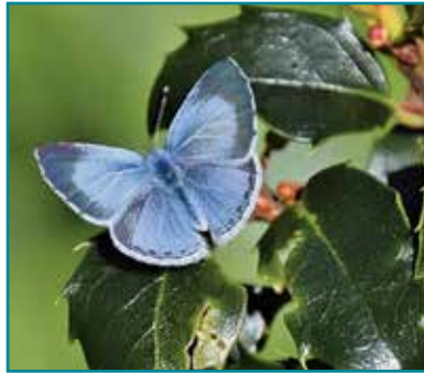
Glöyn byw Glesyn y Celyn

Dyma greadur arall lliwgar a welir yn yr ardd, yn enwedig os oes coed celyn ac iddew/iorwg yn agos. Dyma brif fwyd ar ddechrau bywyd y glöyn byw pert hwn, ond wedyn mae'r oedolion yn chwilio am flodau mwyar a phrivet .