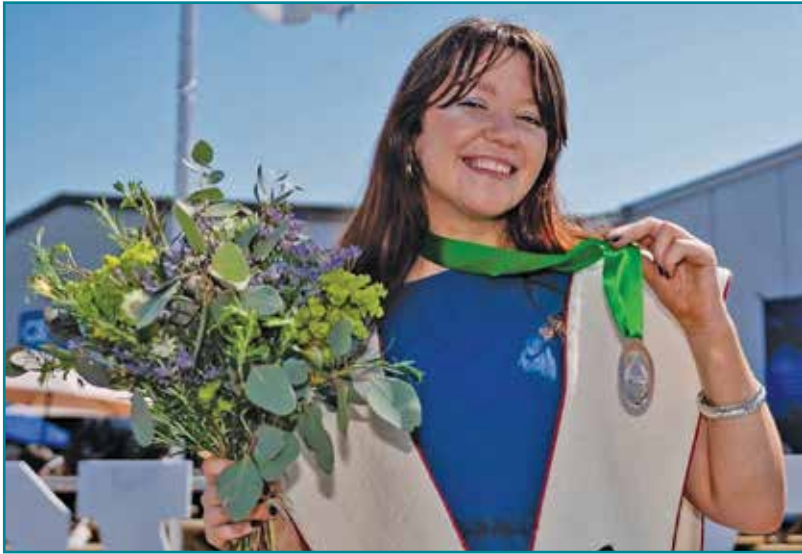
Glain, Prif Ddramodydd Eisteddfod yr Urdd