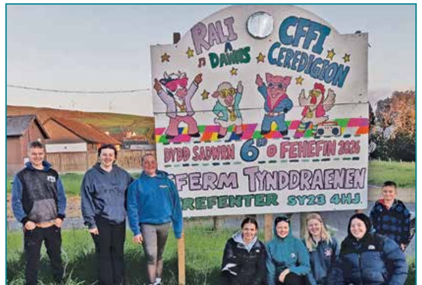
Yr arwydd yn ei le!

Dros yr wythnosau diwethaf, bu llawer o baratoi ar gyfer Rali CFFI Ceredigion ar 6 Mehefin. Fel arfer, bu'r clwb yn brysur yn paentio'r arwydd – diolch o galon i'r holl aelodau a'r arweinwyr am roi o'ch hamser i'w greu a'i godi. Mae'r gwaith caled yn sicr yn talu ar ei ganfed!