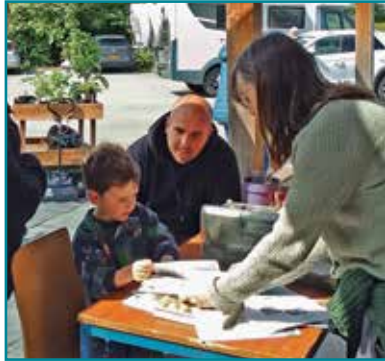
Dysgu am bryfed hofran

Cynhaliwyd ein pumed Wyl y Peillwyr ddydd Sul 17 Mai eleni. Dyma gyfle i ddathlu ein pryfed peillio, dysgu mwy amdany'n nhw a sut i'w helpu, gan fod llawer ohonynt mewn trafferth enbyd. Os nad oeddech chi yno rydych chi wedi colli gwledd! Unwaith eto, roedden ni'n anhygoel o lwcus gyda'r tywydd gan iddi fwrw glaw y diwrnod gynt a'r diwrnod wedyn. Yn ogystal â'r