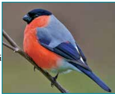
Coch y Berllan

Deiet o hadau a flagur coed ffrwythau sydd at ddant Goch y Berllan ac efallai eich bo' chi 'di sylwi arnynt yn bwydo ar flagur goed ceirios yn y gwanwyn. Er mor hardd eu golwg, roedd arfer difa yr adar ers talwm gan eu fod yn difrodi blagur coed ffrwythau, er nad ydwyf innau wedi sylwi ar unrhyw ddifrod.