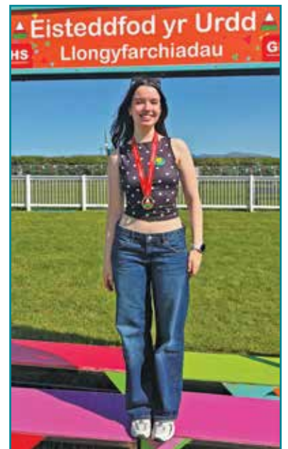
Miri ar lwyfan yr Eisteddfod

Yn ogystal, mae'n falchder gweld cyn-ddisgybl arall o Ysgol Tal-y-bont yn cyflawni mor llwyddiannus ar lwyfan cenedlaethol, gan adlewyrchu'n gadarnhaol ar y gefnogaeth a'r addysg a ddarperir yno. Mae hyn yn dyst i'r ffordd y mae'r ysgol yn parhau i feithrin, annog a datblygu talent ifanc, gan roi sylfaen gadarn i ddisgyblion lwyddo yn y celfyddydau a thu hwnt.