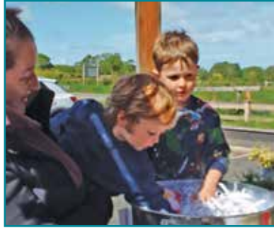
Y Twba Lwcus