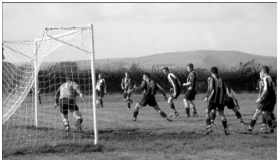
Amddiffyn Tal-y-bont yn gadarn y tro hwn.